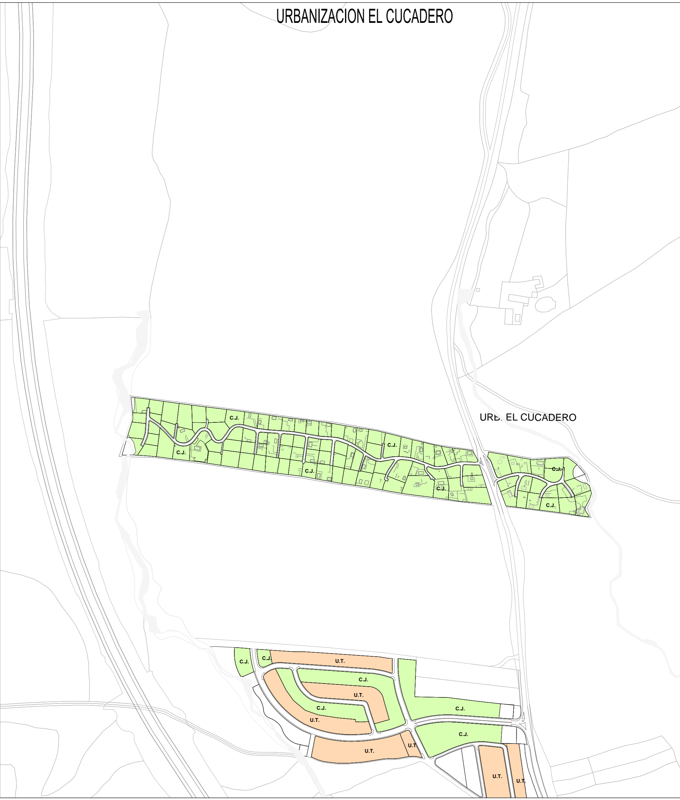
URB. EL CUCADERO