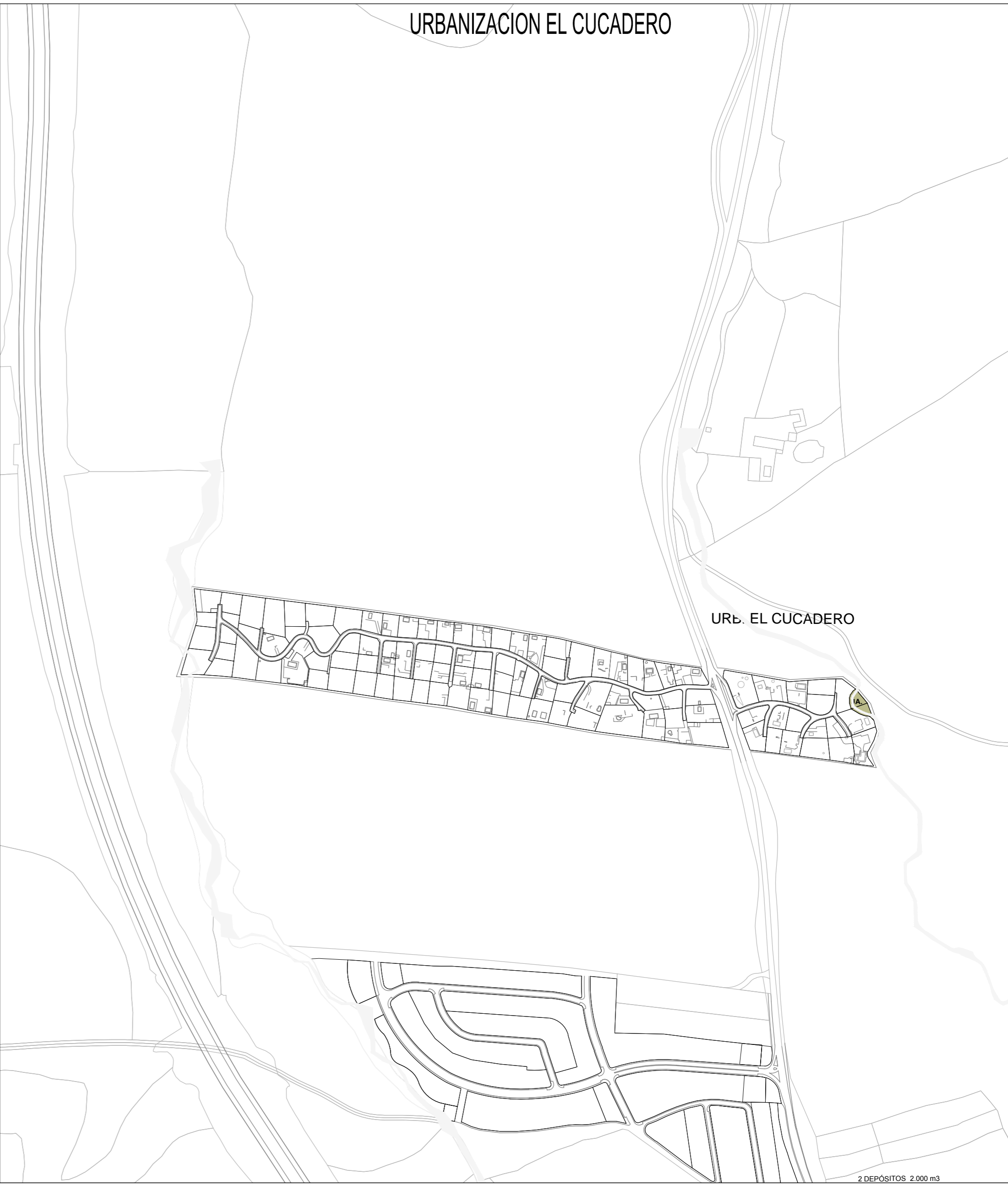
URB. EL CUCADERO