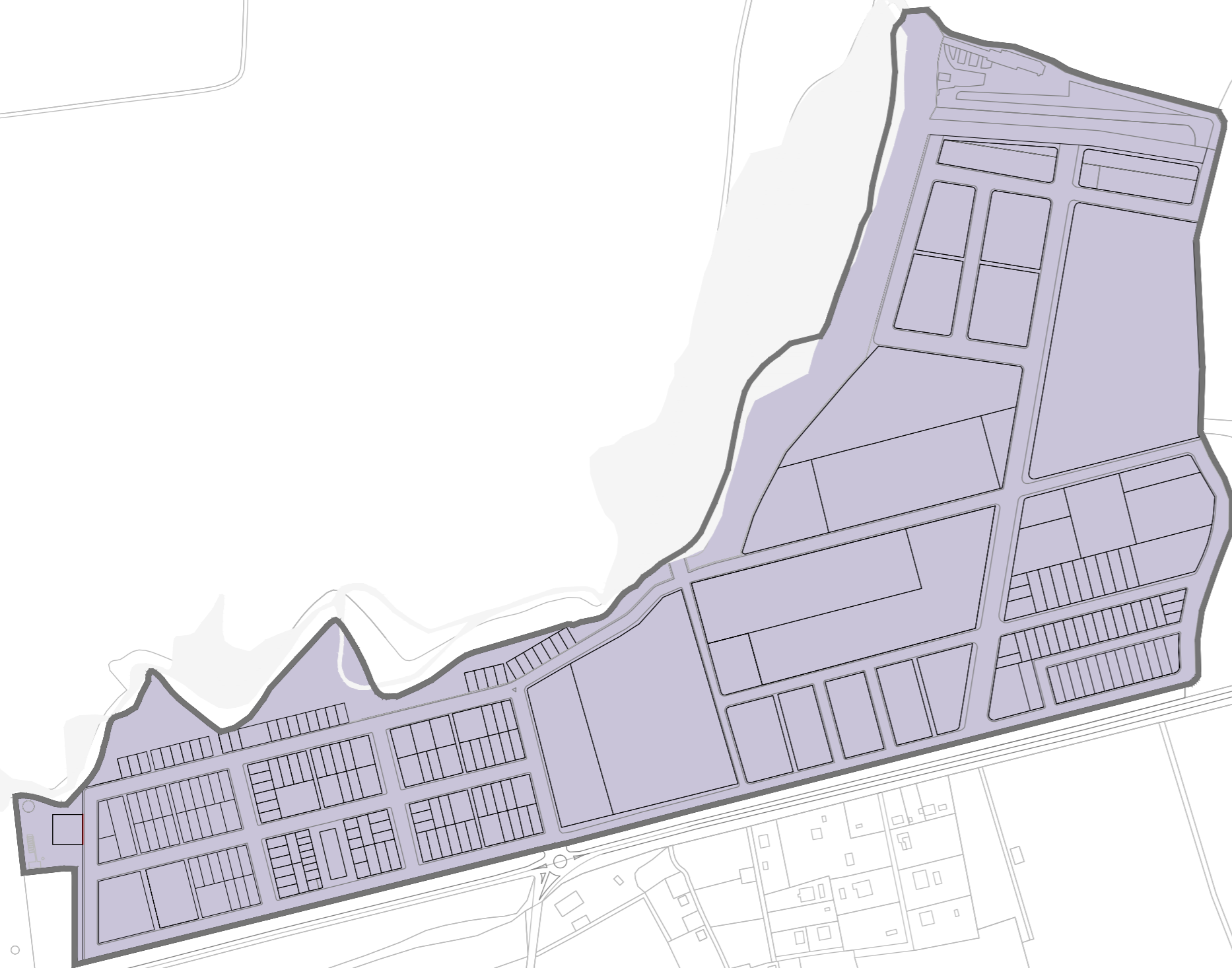
POL. INDUSTRIAL EL CERRO