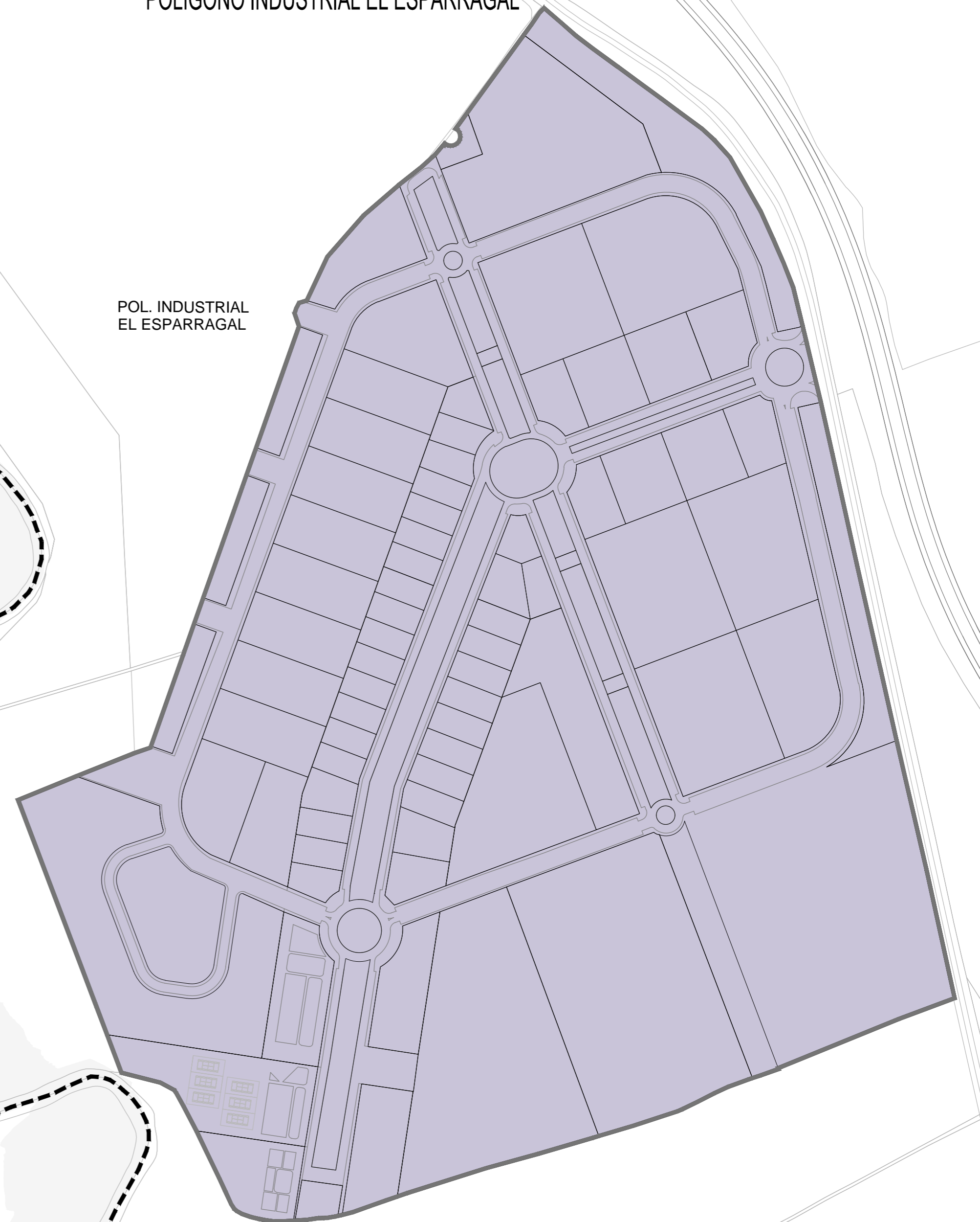
POL. INDUSTRIAL EL ESPARRAGAL