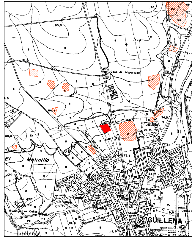
PLANO DE SITUACIÓN EN EL MUNICIPIO. ESCALA 1/20.000