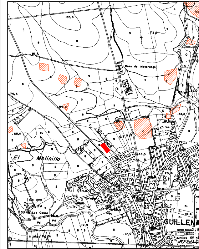
PLANO DE SITUACIÓN EN EL MUNICIPIO. ESCALA 1/20.000