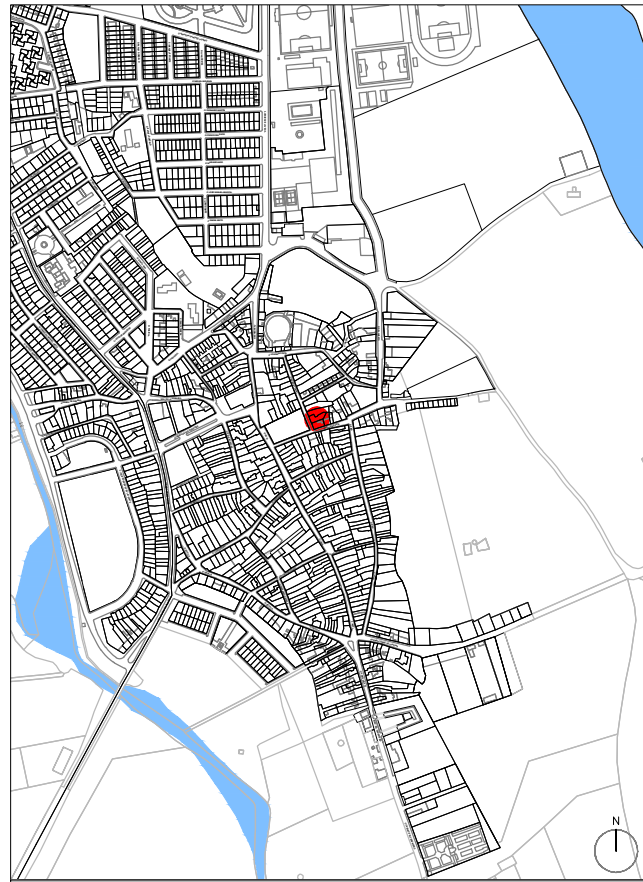
PLANO DE SITUACIÓN EN EL MUNICIPIO. ESCALA 1/10.000