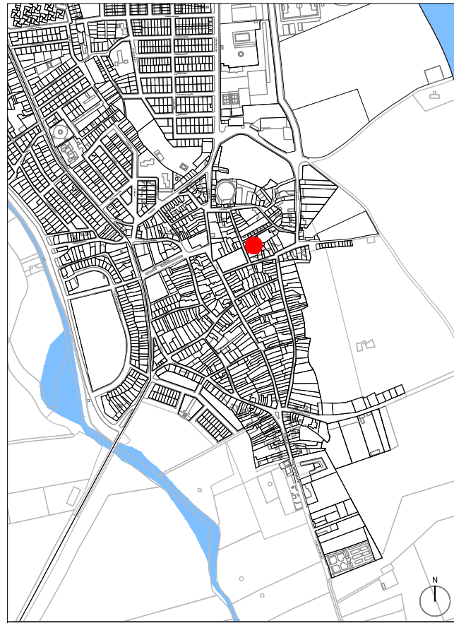
PLANO DE SITUACIÓN EN EL MUNICIPIO. ESCALA 1/10.000