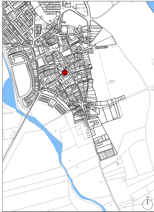
PLANO DE SITUACIÓN EN EL MUNICIPIO. ESCALA 1/10.000