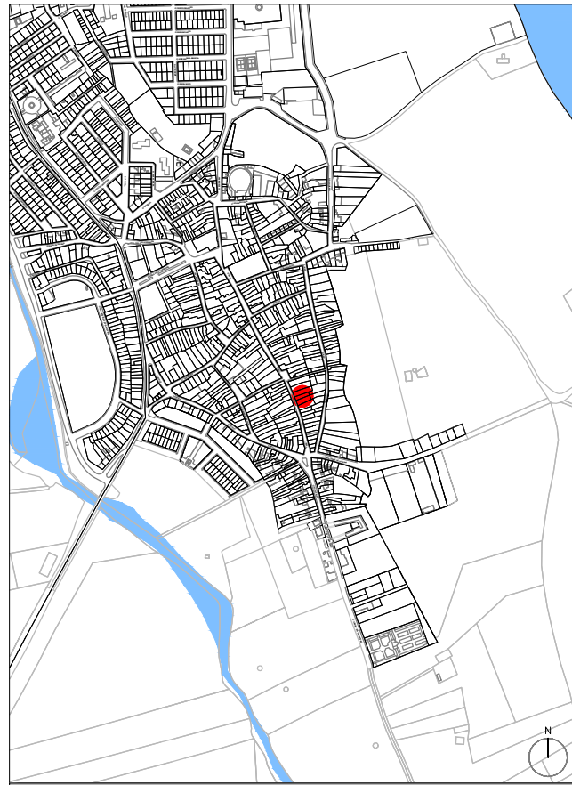
PLANO DE SITUACIÓN EN EL MUNICIPIO. ESCALA 1/10.000