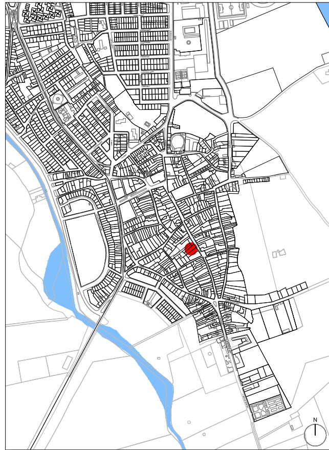
PLANO DE SITUACIÓN EN EL MUNICIPIO. ESCALA 1/10.000