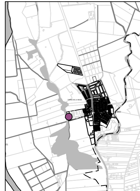
SITUACIÓN TORRE DE LA REINA