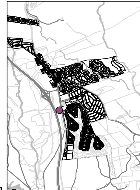
SITUACIÓN LAS PAJANOSAS