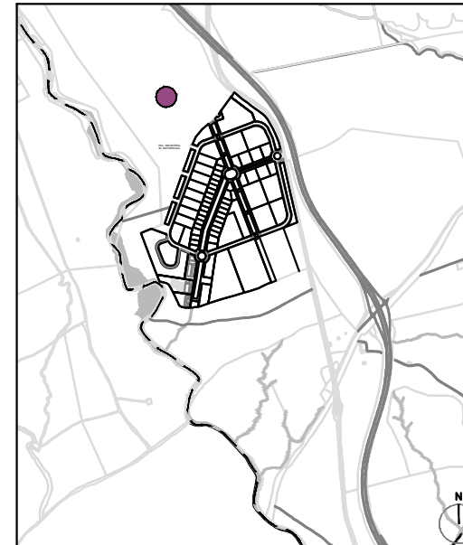
SITUACIÓN EL ESPARRAGAL