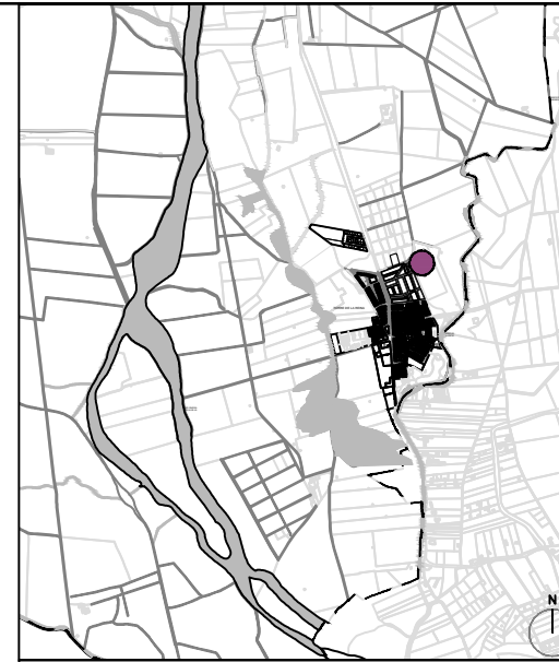
SITUACIÓN TORRE DE LA REINA